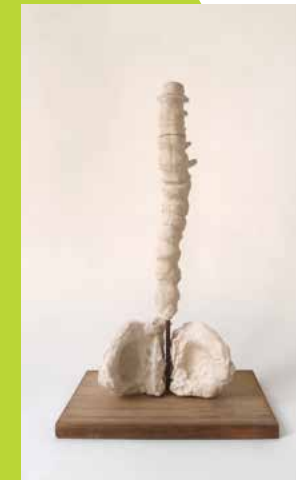
38—40 Yvonne Roeb — Im Über All