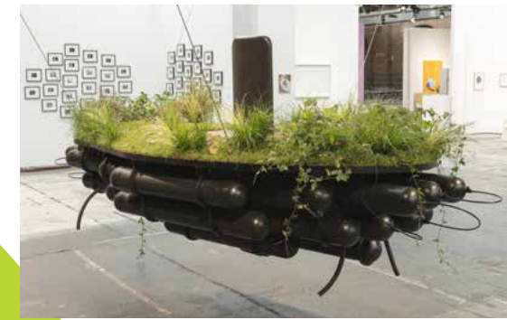
9—12 abc art berlin contemporary